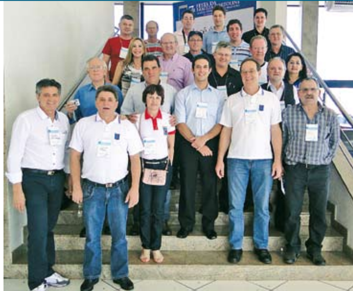
Representantes da AFB e das delegações após escolha de Foz do Iguaçu como sede da 8ª Festa, em 2015

"A Festa ocorreu como esperávamos. Foram três anos de preparação. Acreditamos que nosso intuito de organizar uma festa bonita e que atendesse a expectativa dos Bortolini, vindos de todos os cantos, foi atingido. Certamente, este momento será lembrado por muito tempo pelos que estiveram presentes. Sentimo-nos orgulhosos por ter conseguido realizar o evento com êxito e felizes por termos contribuído de forma significativa para a história e tradição de nossa Família".