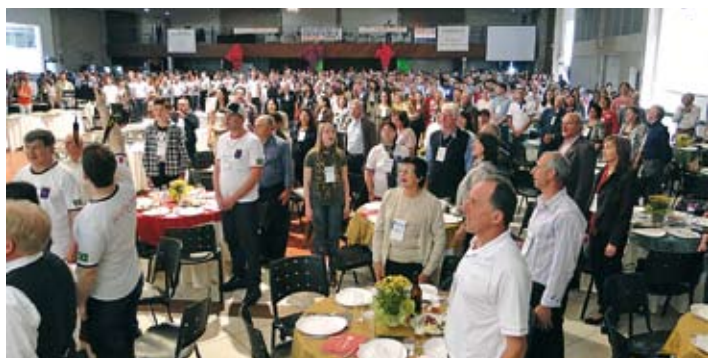
Antes do almoço, o hino da Família