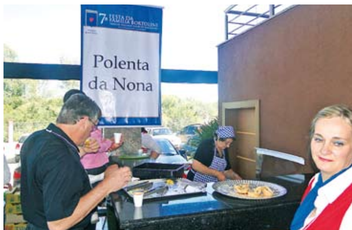
No início da festa, no hall de entrada, a Polenta da Nona