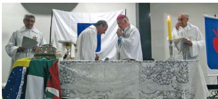
Celebração religiosa ficou a cargo do Arcebispo e de padres da família