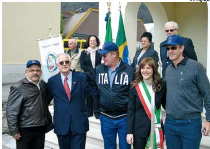
Comitiva foi recepcionada pelo Sindaco de Miane

A primeira viagem do programa aconteceu de 9 a 26 de abril deste ano. No roteiro, visitas na Itália a Fátima, Roma, Napoli, Sorrento, Capri, Pompeia, Costa Amalfitana, Assis, Siena, Firenze, Padova, Mestre,