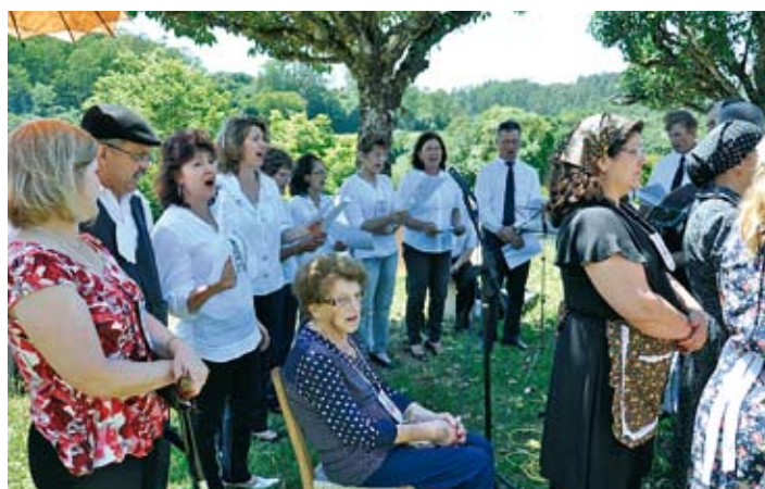
Celebração religiosa sempre é um dos pontos altos das festas Bortolini