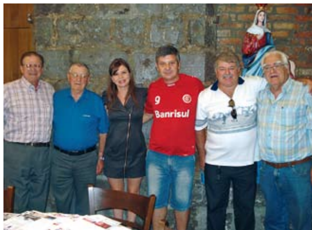
Coordenação do Núcleo de Farroupilha

Um certificado será emitido pela Diretoria Executiva da Associação Família Bortolini (AFB) para referendar a criação do núcleo. A AFB felicita o grupo, agora estruturado em núcleo e espera que seja uma força para a mobilização da grande família Bortolini.