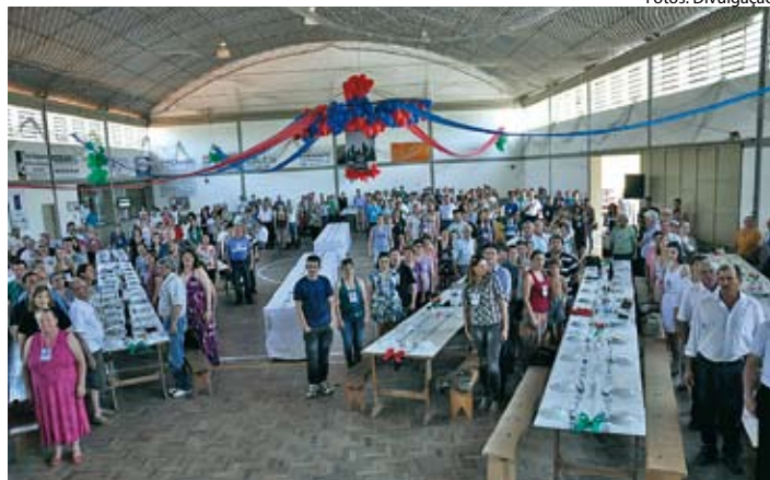
Participantes em momento solene de abertura do evento