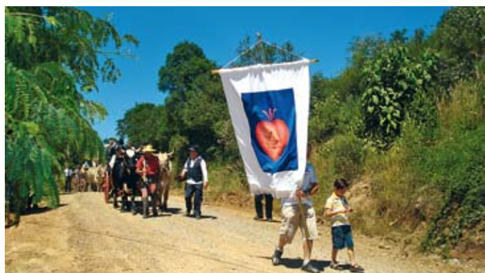
À frente da Comissão, o brasão da Família