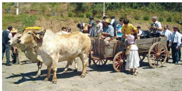
Comissão Organizadora caprichou na caracterização