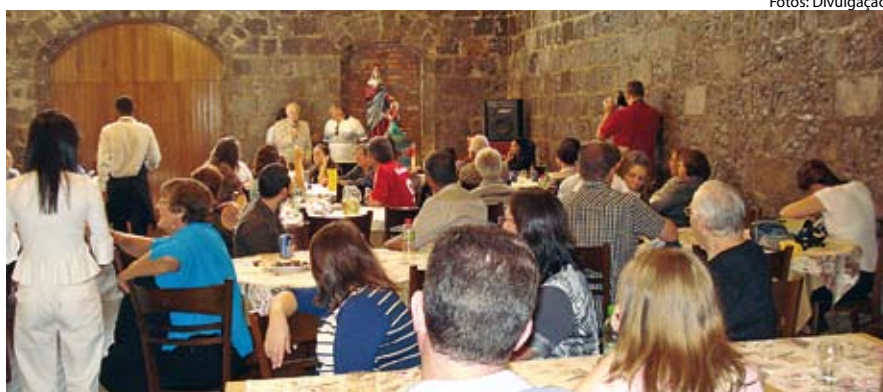
Encontro foi além da interação festiva