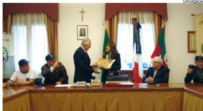
Grupo foi homenageado com placa pela Comunale de Miane