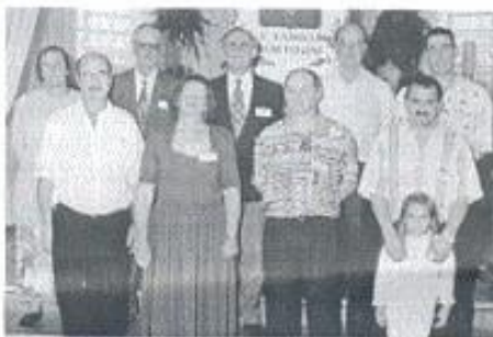
Comissão organizadora da 1ª e 2ª Festas da Família Bortolini

A 2ª Festa da Família Bortolini, realizada no dia 15 de novembro de 1997, na sede da Associação dos Motoristas de Garibaldi, reuniu cerca de 750 pessoas, de diversos Estados do Brasil, além de autoridades municipais. O evento foi marcado por celebração de missa por cinco padres da FAMÍLIA BORTOLINI, com a participação dos corais Massolin dei Fiori e Terezinha Spader, almoço de confraternização, animação e sorteio de brindes, café de la nona e apresentação artísticas, com filmagem documentária.